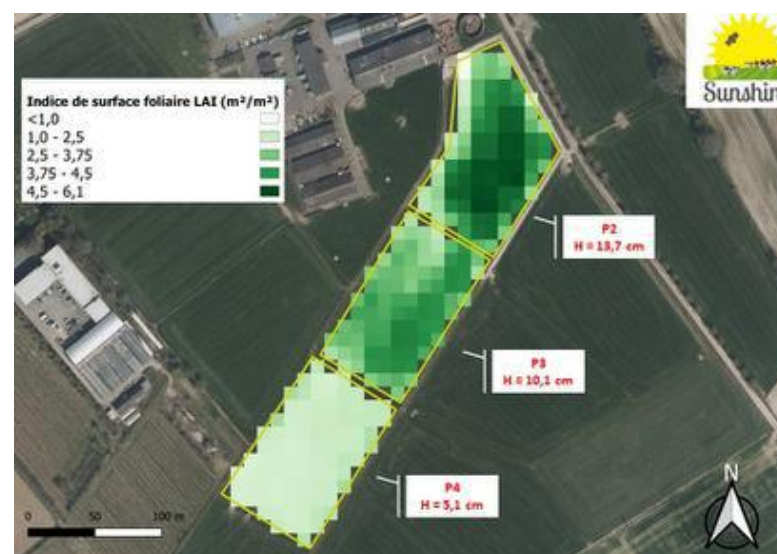
Figure 2 : distribution des valeurs de l'indice de surface foliaire LAI (m 2 /m 2 ) issu d'une image du satellite Sentinel-2 (acquise le 22/04/2021) pour trois parcelles en pâturage tournant situées à Gembloux présentant des hauteurs d'herbe moyennes contrastées. Le LAI est le nombre de m 2 de feuilles vertes par m 2 de sol : plus la valeur de l'indice est élevée et plus la quantité d'herbe présente est importante. L'information satellitaire permet de mettre en évidence la différence entre parcelles mais également la variabilité intra-parcellaire. Cra-w