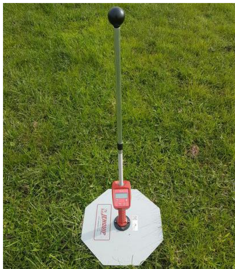
Lorsque l'herbomètre est connecté, comme celui-ci, les mesures prises en prairies peuvent être exportées directement sur ordinateur ou smartphone. Cra-w

La prise de mesures de hauteurs d'herbe s'effectue préférentiellement